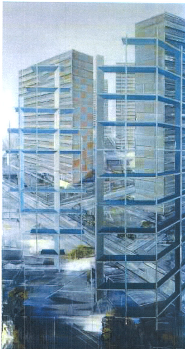
Unter uns, 2014, huile sur toile, 200 x 300 cm

personnages en mouvement très expressifs, comme en fuite... C'est d'ailleurs ce qu'il s'apprête à faire lui-même. Car Driss Ouadahi sent qu'il faut lever le camp une fois de plus. L'apprentissage trop scolaire et le climat politique incertain l'ont décidé... Depuis l'Allemagne où il arrive en 1987 il suit, impuissant, la décennie noire qui s'abat sur son pays natal. Le